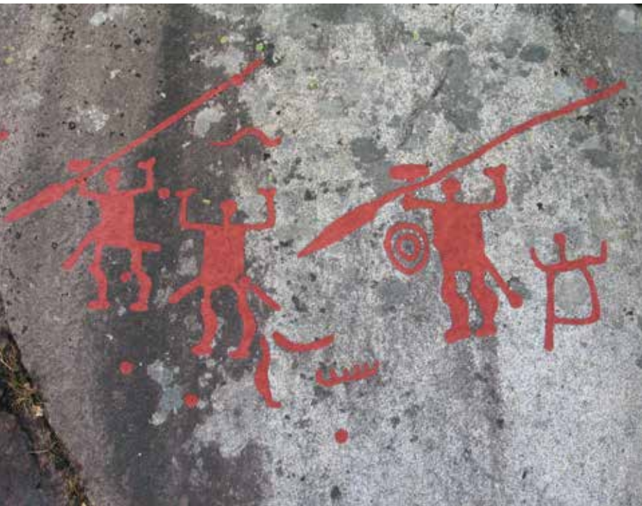
2 Darstellung von Kriegerern mit Lanzen und Schwertern, die in der Schwertscheide am Gürtel getragen werden, auf den berühmten Felsbildern der Nordischen Bronzezeit. Die Abbildung stammt aus Tanum, Bohuslän (Westschweden).