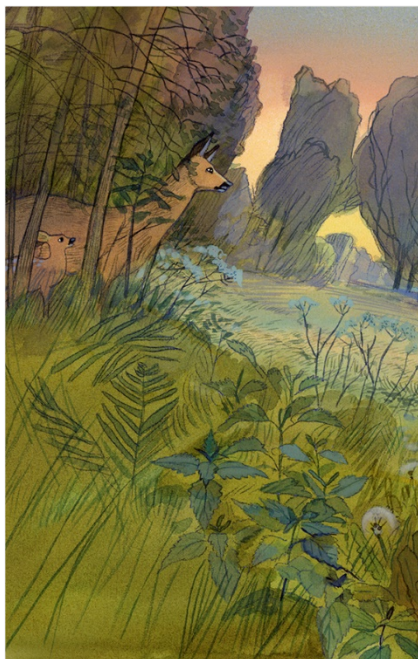
FELIX SALTEN (1869-1945) Vater von BAMBI und seinen Kindern