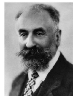
„ Die Nation oder der Sinn fürs Soziale “