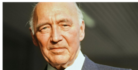
„ Nation, das heißt in erster Linie Staatsbürgergemeinschaft nicht Sprache, Ethnie oder Kultur. “