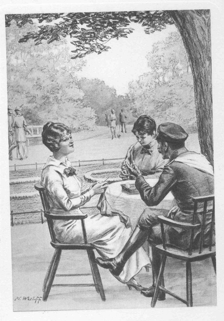
Majors Einzige im Kriegsjahr