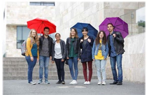
Wir lassen neue internationale Studierende nicht im Regen stehen