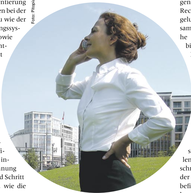
Die Abteilung Personalservices hat die Reisekostenabrechnung erleichtert.

Aufgehört hat das Immobilienmanagement bei den Kundenwünschen zur Hörsaalverwaltung. Diese kümmert sich als Ergebnis der Befragung verstärkt um die gewünschte Ausstattung der Veranstaltungsräume bei