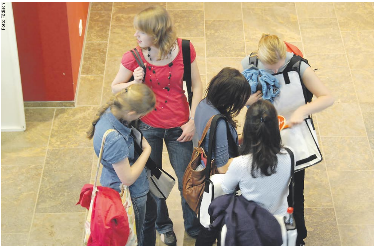
Erstsemester unterwegs bei der Einführungsmesse „unistart“ – wie die Studieneingangsphase verläuft, ist oft entscheidend für den weiteren Studienverlauf.

Echte Teamarbeit – wie der Bund-Länder-Antrag für die Lehre entstanden ist