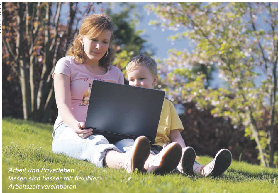
Arbeit und Privatleben lassen sich besser mit flexibler Arbeitszeit vereinbaren

Aktuell gibt es an der Goethe-Universität zwei Dienstvereinbarungen: